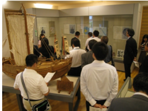
高田屋嘉兵衛建造の船など探検の歴史