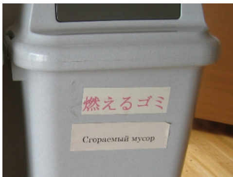
館内施設の多くは日本語ロシア語併記