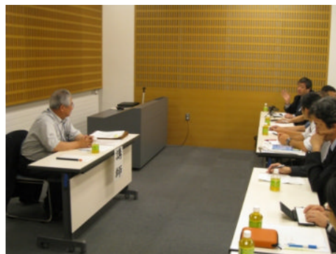
活発に交わされる質疑応答