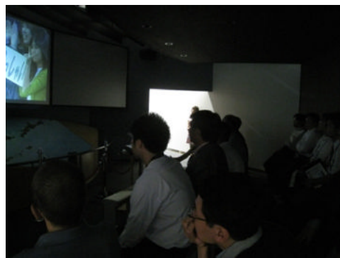
ビザなし交流紹介ビデオを視聴