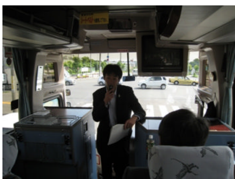
車内でのレクチャー

根室市役所から納沙布岬までは根室市役所北方領土対策課の職員に同行していただき、根室市における返還要求運動の様子について、説明していただきました。