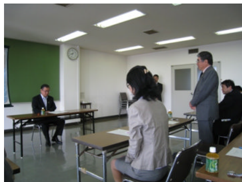
事務局長より挨拶