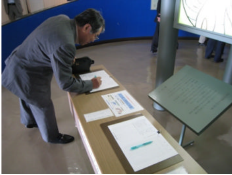
入り口に設置された署名簿