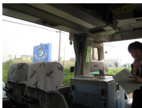
納沙布岬までの道路沿いには啓発看板が多数