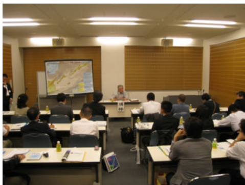
元島民の体験談に聞き入る参加者

色丹島（斜古丹）出身の元島民（語り部）から四島での暮らしやソ連軍による占領、強制送還、根室に入ってからこれまでの返還要求運動についての経験談を伺いました。