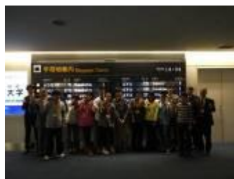
東京に帰る（羽田空港）