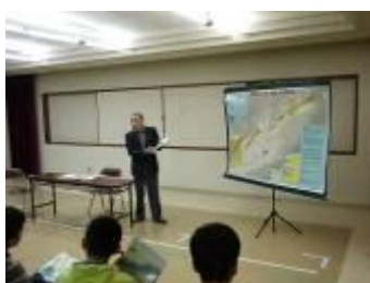
元島民による講話とメモを取る生徒（羅臼町）