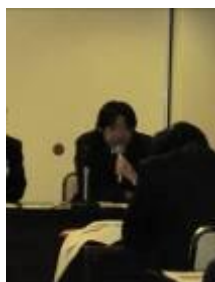
地元教員との交流