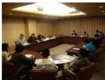
ふりかえり（根室市）