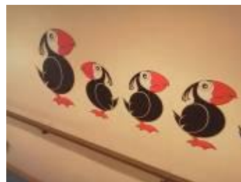
えとぴりか号 (内装)