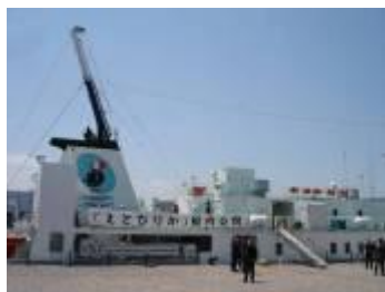
えとぴりか号 (外観)