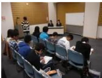
北方領土出前講座、根室高校生との交流（根室市）