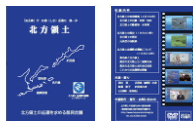
映像資料「北方領土」パッケージ

内 容 北方領土の自然・歴史・返還運動など 部 数 450部(区市町村・教委等へ配布)