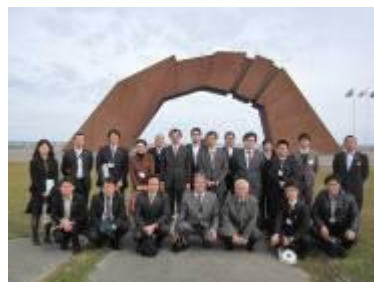
四島（しま）のかけはし