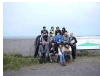
国後島を背に（野付半島）